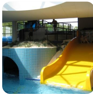
Rutsche und Düne